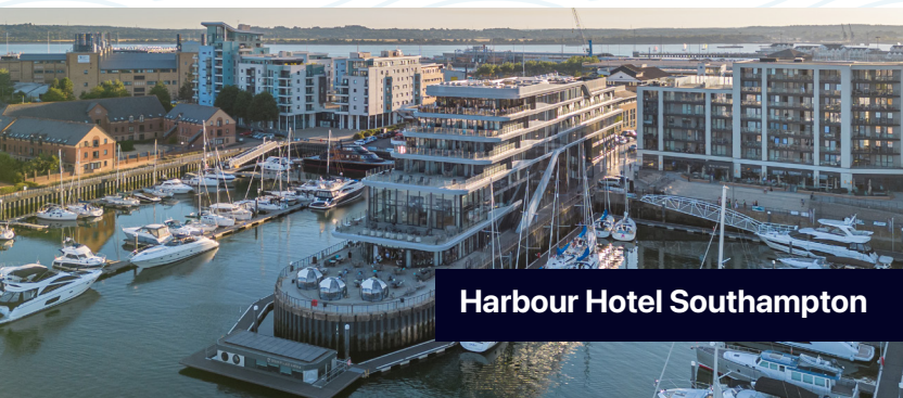
Harbour Hotel Southampton