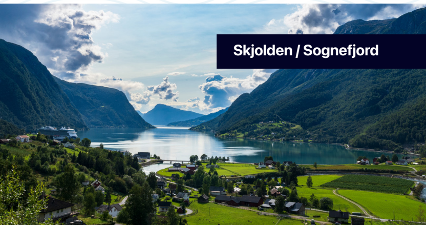
Skjolden / Sognefjord